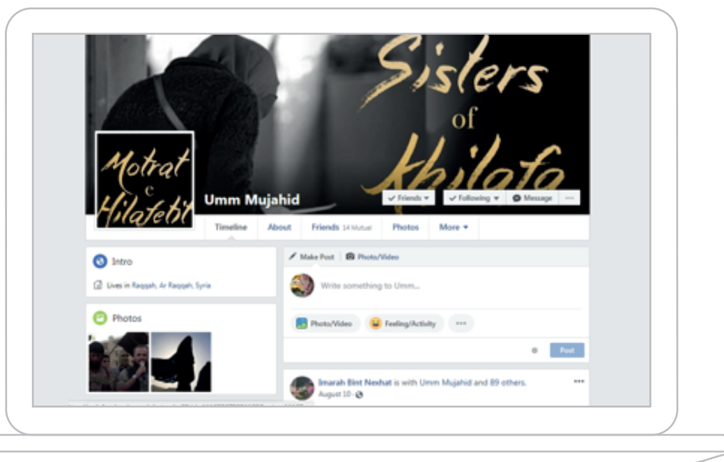
Foto 3: Profili i një gruaje që mbështet faqet e ekstremistëve në Facebook

Për më tepër, shumë prej grave duket se e shpërndajnë të njëjtën propagandë të ISIS-it edhe mes anëtarëve të tjerë të familjes. Siç shihet nga transkriptet e gjykatës, njëra prej grave përpiqet t’i paralajmërojë të tjerët duke pretenduar se “shteti laik ka me ia marrë fëmijët një myslimani që nuk i çon në shkollë. Ne duhet të shkojmë atje ku do të gjykohesh nga ligji i Sheriatit” 95