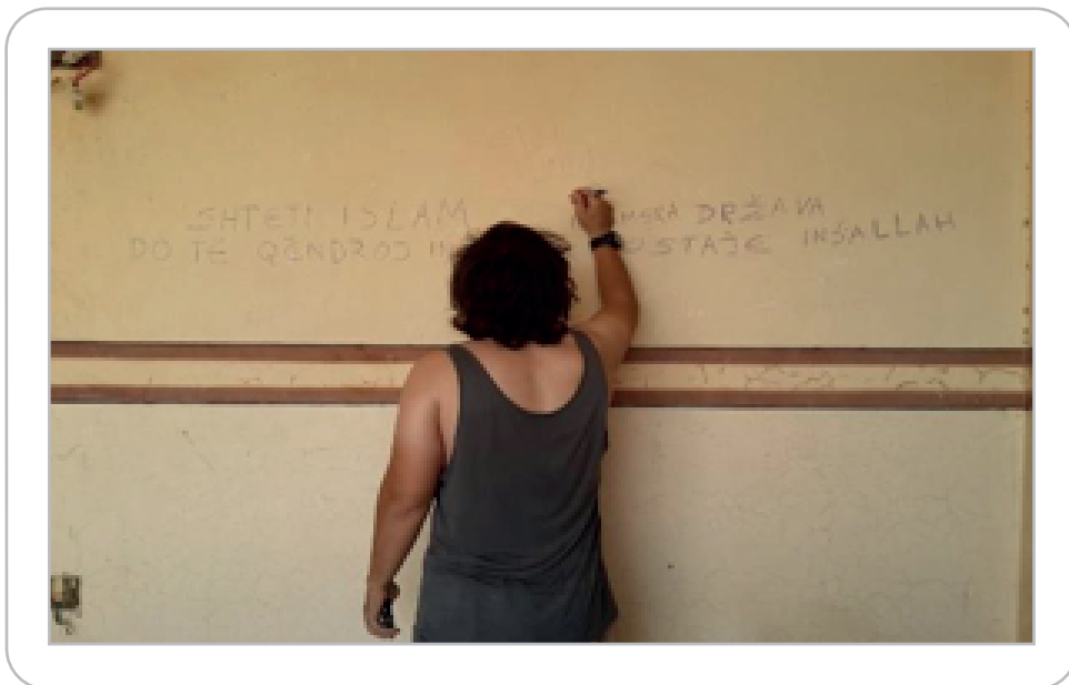
Foto 2. Foto e marrë nga profili në Facebook i një simpatizanti të ISIS-it

Siç shihet në foton e mëposhtme, ku është shkruar “Shteti Islam do të Qëndroj”, ndërkohë që ISIS-i ka humbur territorin, simpatizuesit e ISIS-it vazhdojnë ta mbështesin idenë e kalifatit dhe ‘ta mbrojtjes së umetit mysliman nga kufarët’.