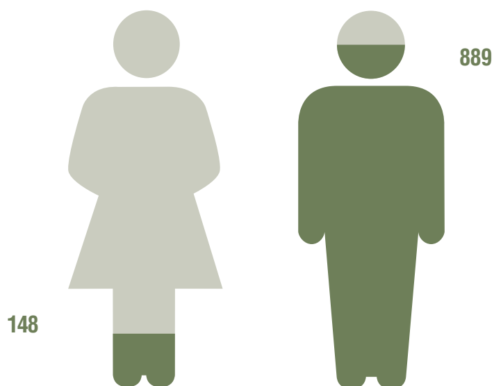
Figura 3 - Përfaqësimi gjinor i komunitetit serb të Kosovës në Policinë e Kosovës (stafi civil dhe zyrtarë policorë) 57