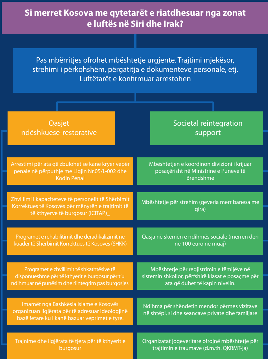
Figura 1: Qasja e përmblodhur dhe e thjeshtuar e mënyrës si merret Kosova me luftëtarë të huaj dhe qytetarë të tjerë të riatdhesuar nga zonat e luftës në Siri dhe Irak.